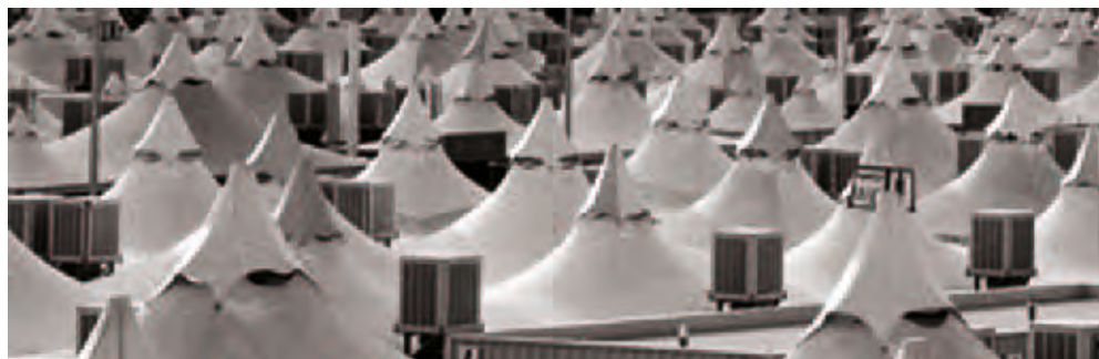
Piltidel: ülal vaade Mediina mošeele ja surnuaiale, keskel Mediina mošee kuppel, Kaaba uks, all Mina telgid.