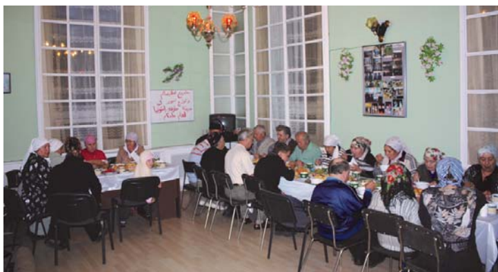
Ифтар в Марду