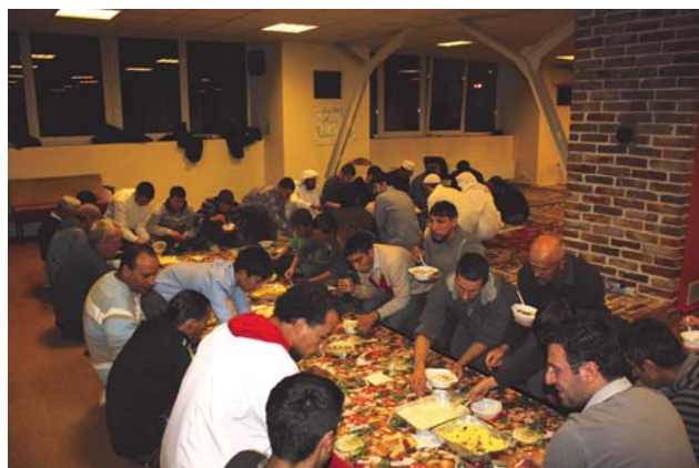
Ифтар в Таллинне