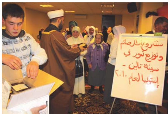
Раздача фиников в Таллинне