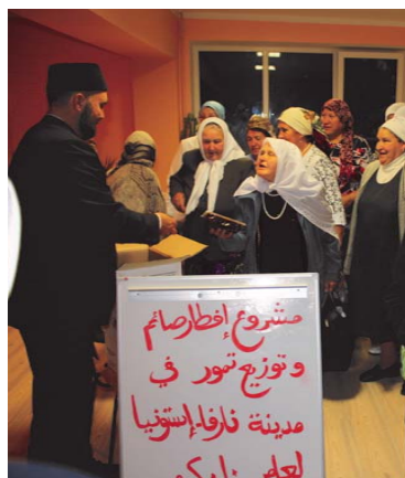
Раздача фиников в Нарве