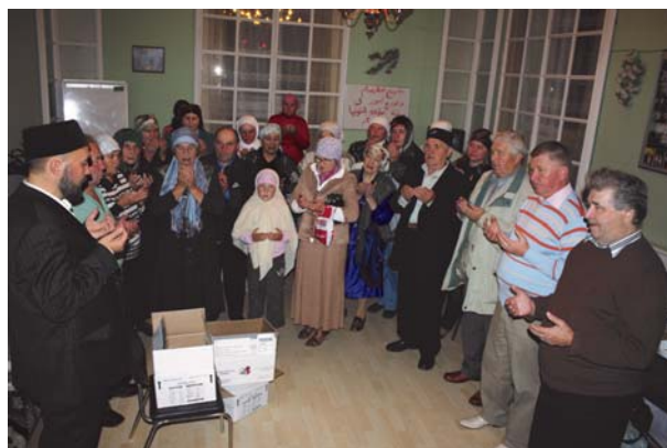
Раздача фиников в Марду