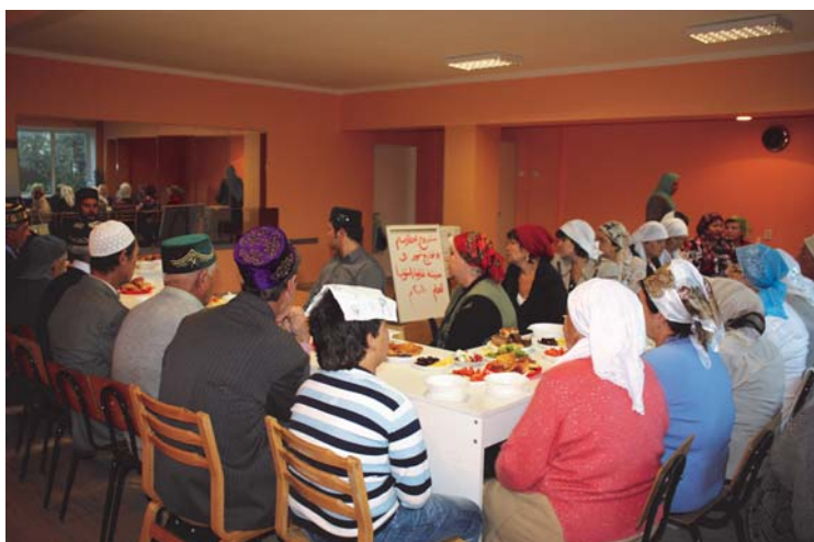
Ифтар в Нарве